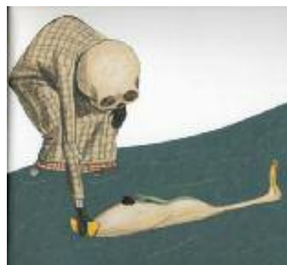
Erilbrusch, W. (2007). El pato y la muerte

XXI. mendearen lehen urteetan, bikoiztu egin da heriotza gai nagusi duten haurrentzako lanen kopurua. Alta, he-