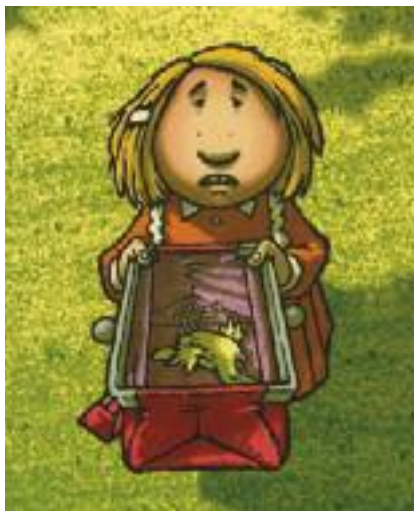
¿Como es posible?! La historia de Elvis.

Jaiotzeak heriotza du zor esaera zaharrak laburbil dezake, askotan, ezkututzen dugun errealitate horren mami: heriotza beti egongo da, ezin dugu ezer egin; gertatuko zaigu, eta gertatuko zaie. Hala ere, haurrekin gai horretaz hitz egiten badugu eta gaia naturaltasunez ateratzen badugu, zama hori eramaten lagundu egingo diegu, edo zama hori arinago eramaten, behintzat. Lan horretan, tresna egokiak izan daitezke albumak. Eta hiltzen jarraituko dugu, eta tristea izango da, beti. Baina, norberak horrelako gertaera baten aurrean egin behar duen dolua egiteko, tresna egokiak eskaini diezazkiekegu.