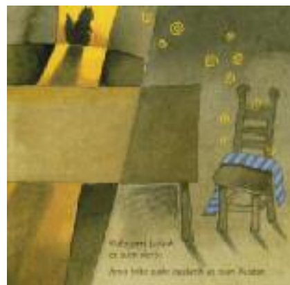
Ramón, E. (2003). No es fácil, pequeña ardilla