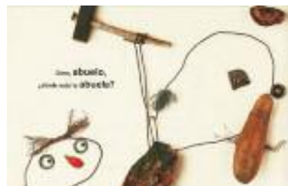
Voltz, C. (2008). "La caricia de la mariposa"

SCHÖSSOW, Peter: ¿Cómo es posible?: La historia de Elvis , Lóguez, 2006: album honetan, neska bati txoria hil zaio. Parkean dabiltzan lagunek lagundu egingo diote mina arintzen. 6 urtetik gorako haurrentzat.