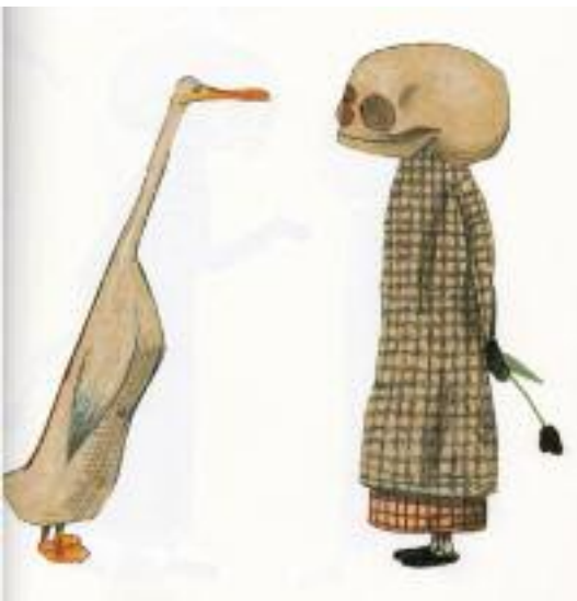
Erlbruch, W. (2007). El pato y la muerte

ez dela gai egokia hurrekin lantzeko, haur bati azaltzeko. Hortaz, sexuarekin, homosexualitatearekin eta beste hainbat gairekin batera, tabuen zakuan ezkututzen dugu heriotzaren gaia. Eta ezkutatze hori familian eta komunikabideetan ere gertatzen da. Irakasleok eta, oro har, helduok geure buruari galdetu beharko genioke zergatik ezkututzen dugun era horretara horren naturala eta unibertsala den gai bat, denoi gertatu behar zaigun gertaera bat.