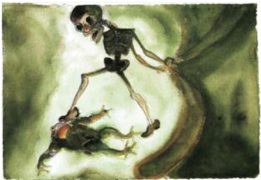
Toledo, N. (2006). La Muerte pies ligeros

Izan nuen beste ezustekoa sexuen trataera izan zen. Nire hipotesiaren arabera, sufrutuko zuena eta sentimenduak adieraziko zituen neskatoa, neska, emakumea izango zen. Sexuen trataera, ordea, oso orekatua da aztertu di-