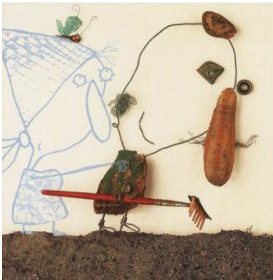
Voltz, C. (2008). "La caricia de la mariposa"

tudan albumetan; hau da, batez ere dolua haurrek bizi dute, eta ia neurri berean sufritzen dute neskek eta mutilek. Eta oreka hori ez da alde kuantitatiboan soilik agertzen, biek sufritzen eta azaleratzen baitituzte sentimenduak; are harigarriagoa da hori, kontuan izanik sentimenduak adieraztea beti emakumearen rola izan dela. Are gehiago, heriotzarekin oso lotuta dagoen sentimendu bat, beldurra, batez ere mutilek adierazi edo azaleratzen dute. Heriotzaren aurrean oldartzea, ez konformatzea, hori batez ere neskek agertzen dute. Aitzitik, laguntzeko zeregin edo funtzioari dagokionez, dolua egiten ari den haurri laguntzen diona emakumea da beti: haurri gertatutakoa azaltzen diona, haurra babesten duena, eta abar, emakumea da: ama, amama... beti emakumea. Gizonari ez zaio babes- edo laguntza-funtzio hori egiteko aukerarik ematen. Arlo horretan, sexuen ikuspegitik, beraz, ez da batere orekatua.